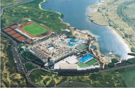
Club la Santa / İspanya

KAYNAK : Veriler ' Spor Turizmi Uluslar arası Konseyi (STIC)' alınmıştır.