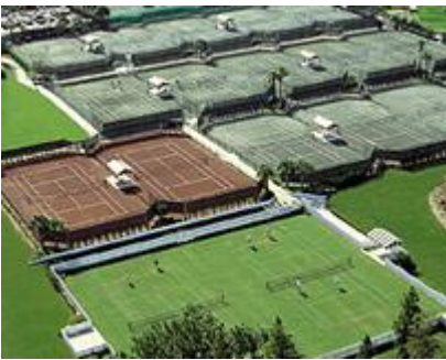
Saddlebrook Hotel / USA