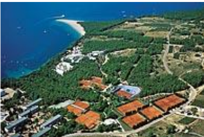
Grand Hotel Elaphusa / Hırvatistan